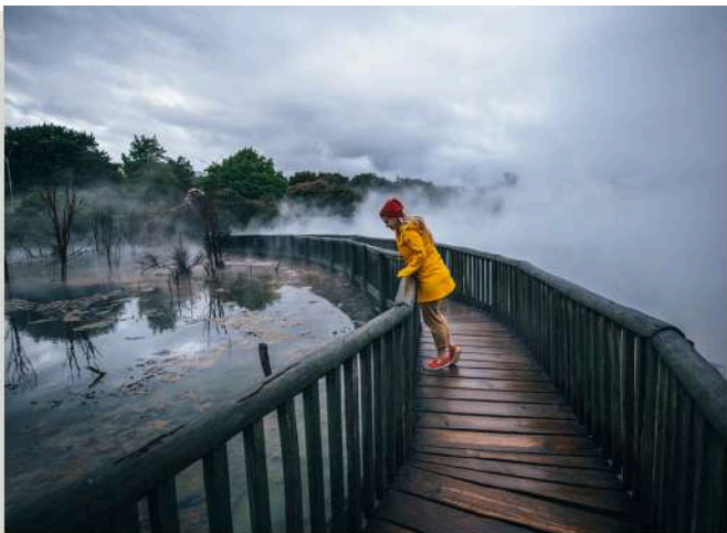
庫伊勞公園 Kuirau Park

3D 立體視覺藝術館 ：擁有五大主題的3D立體視覺藝術館，共有50多幅3D藝術畫作，其中還有經典畫作「蒙娜麗莎」、「戴珍珠耳環的少女」等。一起來發揮創造力，來場視覺遊戲，置身畫中，拍出屬於自己的趣味故事。