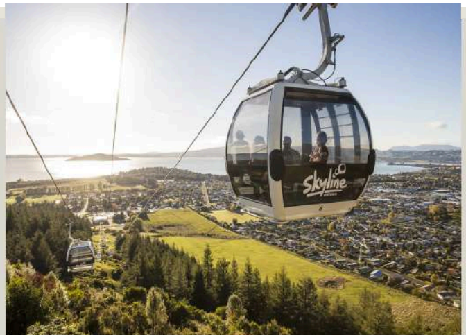
羅吐魯阿空中纜車 Rotorua Skyline Gondola