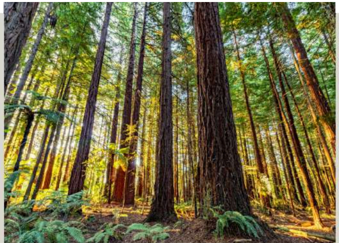
紅木森林 Redwood Forest