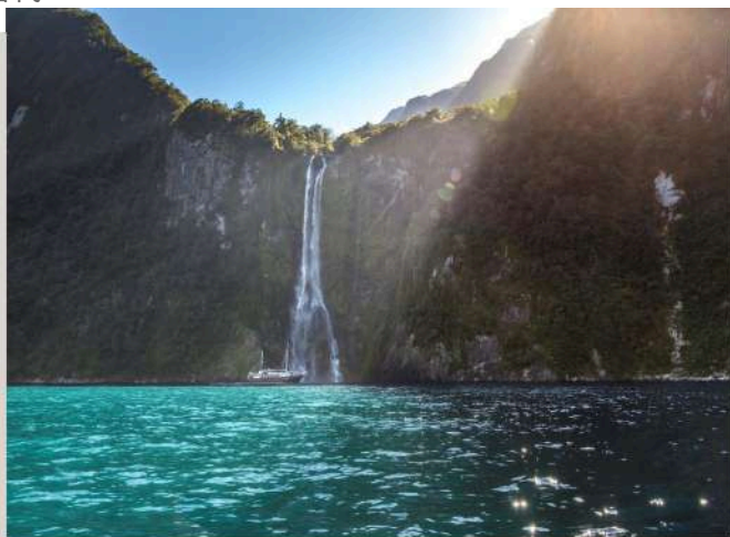
米佛峽灣 Milford Sound

米佛峽灣遊艇巡弋 : 專車行走在世界著名的觀景公路上，公路兩側覆蓋著茂密的原始溫帶雨林，整個峽灣地帶也是紐西蘭野生動物的棲息處，260萬公頃的區域在1990年已列入世界自然遺產保護之列。從冰河時期到現今形成的峽灣面貌，國家公園三分之二的土地上覆蓋住紐西蘭原始山毛櫸和羅漢松為主的植被，接著我們將搭乘郵船遊覽米佛峽灣，豐沛的雨量讓沿途陡峭的高山上常常出現間歇性瀑布，如天氣多雨，甚至可同時看到上千條瀑布，使峽灣國家公園的自然景觀一年四季都充滿與眾多國家公園不同的美景。*備註：若遇雪崩或道路封閉等不可抗拒之因素，則安排退費為替代。