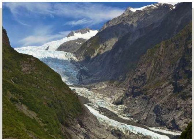
西地國家公園 Westland National Park