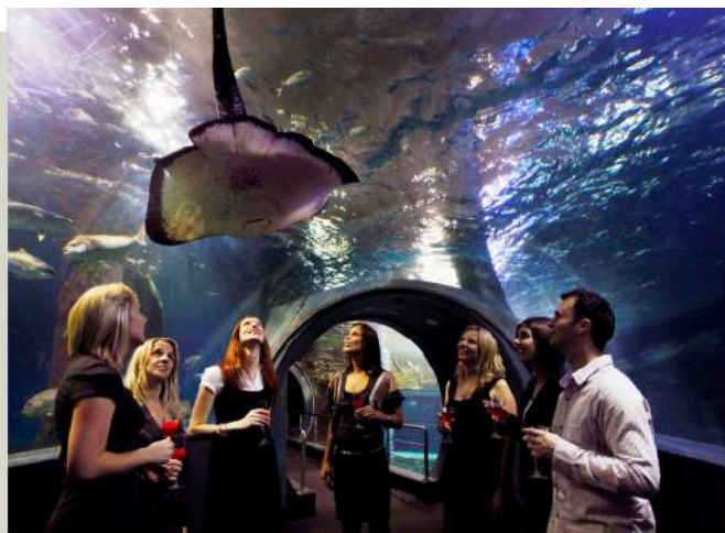
凱莉達頓水族館 Kelly Tarltons Aquarium