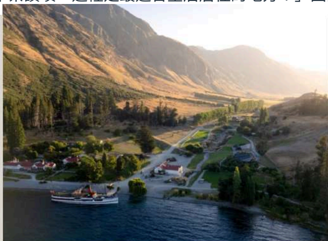
沃爾特峰農莊 Walter Peak High Country Farm

皇后鎮 ：四周環繞著高達2000公尺的里馬克伯山脈與坐落於其間的瓦卡提普湖，美景天成，脫俗雅致，有如仙境般的秀麗景緻。19世紀中葉，來自世界各地的淘金客在偶然的機會下發現此地，不禁讚嘆「這裡是最適合皇后居住的地方！」因而得名。