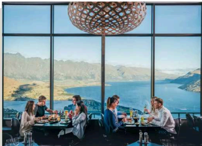
山頂景觀餐廳 Skyline Restaurant