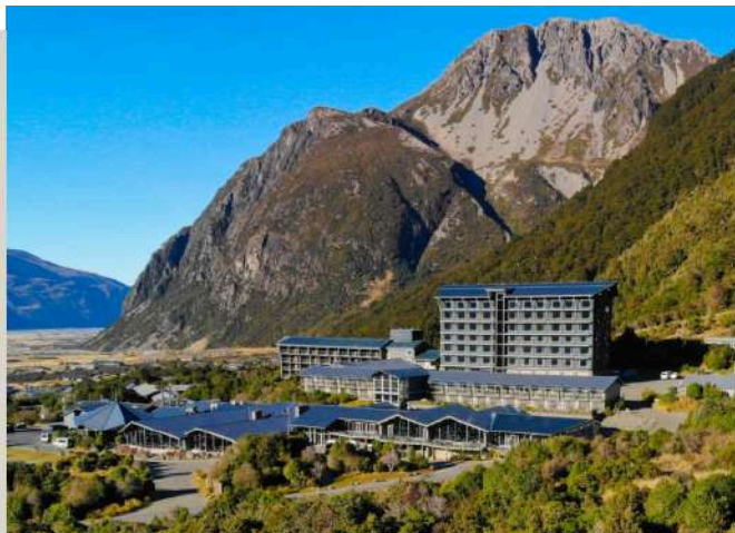
庫克山隱士飯店 The Hermitage Hotel

爛的星空。本行程安排入住於庫克山區域的隱士集團飯店，讓您體驗絕美的山景風貌，飯店住宿以團體訂房，恕無法保證入住房型，敬請瞭解。