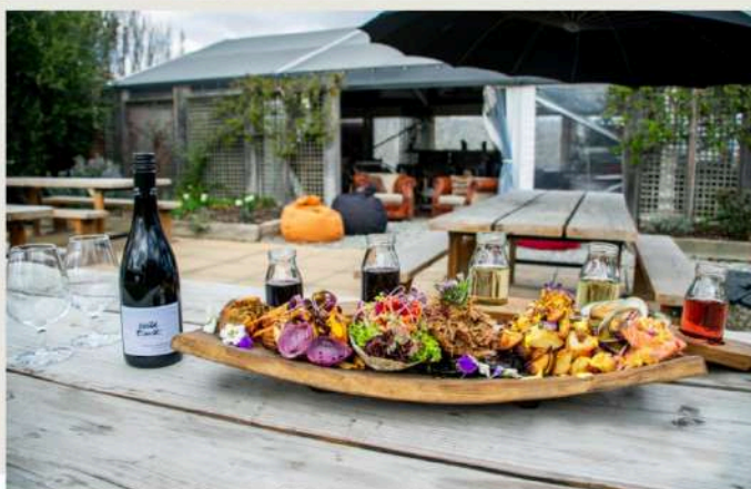
The Stoaker Room

來到南緯45度，一定要品嚐當地的葡萄酒，地形、氣候、日照相輔相成下結合的絕世美味；酒酣之餘，配著用葡萄酒桶煙燻、烤製的烤肉，一口酒，一口肉，把平常堆積的疲勞與煩惱拋諸腦後。