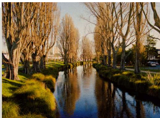
雅芳河 Avon River