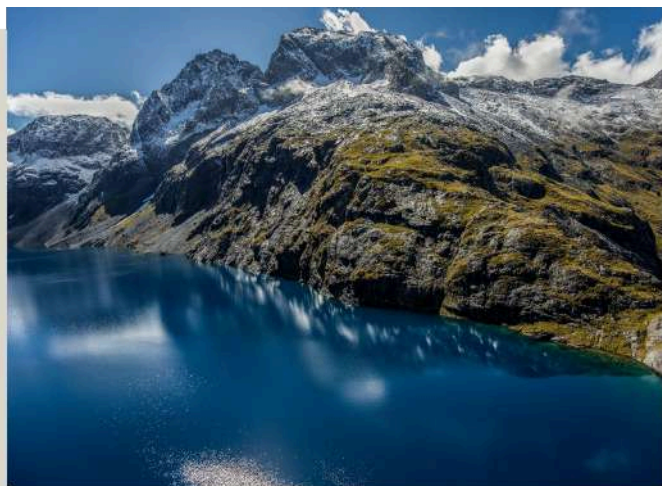
峽灣國家公園 Fiordland National Park