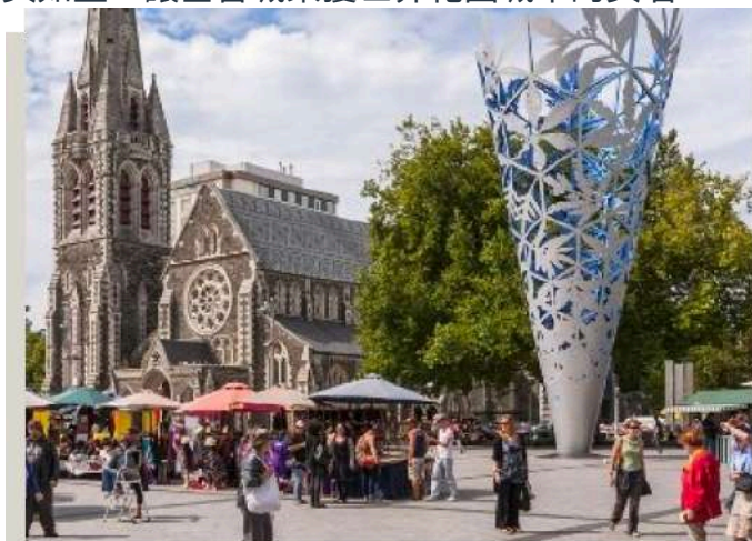
紐西蘭南島最大城市 - 基督城

夢娜維爾花園 ：基督城花園中的經典代表，佔地約 5.5 公頃，聳立於雅芳河畔。這座小橋流水、綠草如茵的花園，小河裡時常伴著鴛鴦、水鴨、小魚悠遊自在，搭配著都鐸風格的建築，景緻優美如畫，讓基督城榮獲世界花園城市的美名。