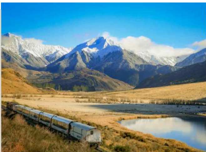
高山觀景火車 Tranz Alpine

西地國家公園 ：南島的西海岸波瀾壯闊，伴隨著南阿爾卑斯山脈美景不斷，有奇特的溫帶雨林及成千的海鳥聚集山丘上。