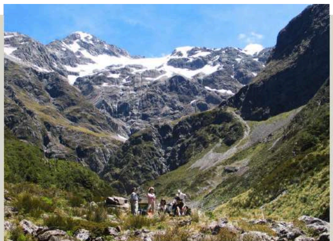
亞瑟隘口國家公園 Arthur's Path National Park