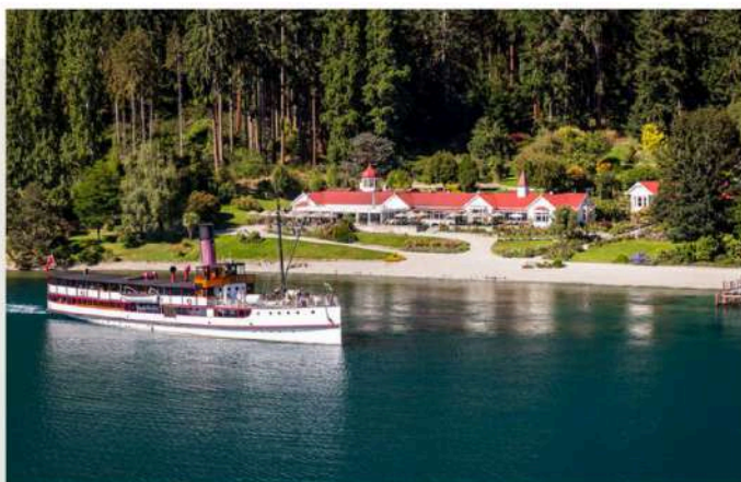
Walter Peak High Country Farm

搭乘二戰時期的百年蒸汽郵輪來到沃爾特峰農莊，一邊觀賞湖邊花園，一邊享用紐西蘭式的烤肉。飯後在農莊內散散步，與農莊內的羊群們互動，又是一個悠閒的午後。